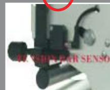
ДАТЧИК НАТЯЖЕНИЯ ТКАНИ