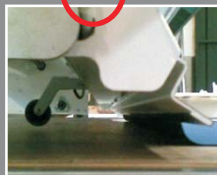
ДАТЧИК ВЫСОТЫ НАСТИЛА