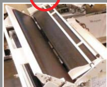
СПЛОШНАЯ ЛЕНТА КОЛЫБЕЛИ